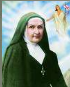
Bł. Celina Borzęcka CR (1833-1913)